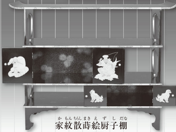
かもんちりまきえずしだな 家紋散蒔絵厨子棚