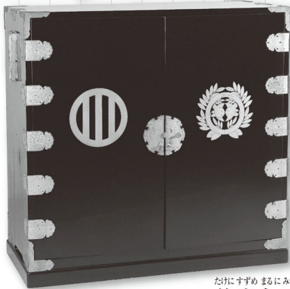
たけすずめつらにみつひきもんきえだんす 竹雀丸三引紋蒔絵箆笥

【展示解説会】 ①1月8日(日) ②1月29日(日) こんいとおしどうまるくそく ③2月19日(日) ④3月11日(日) 紺糸威胴丸具足 各日、午前11時～12時