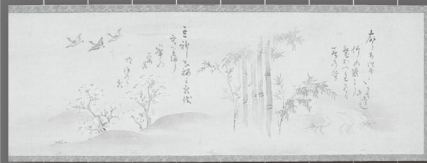
たむらむねよしじひつわか 田村宗良自筆和歌