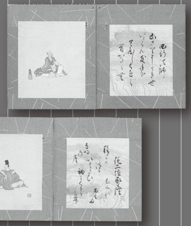
たむらたけあきてかがみ 田村建顕手鑑